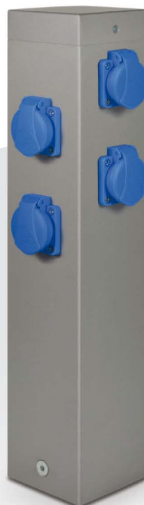
typ RS (lakovaný)