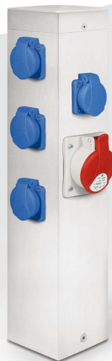
typ RS-N (nerezový)