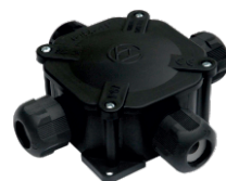
možnost i v černém provedení